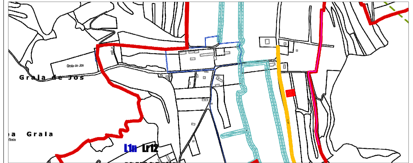
INCADRARE IN PUG MEDIAS - REGLEMENTARI UTR scara 1:10000