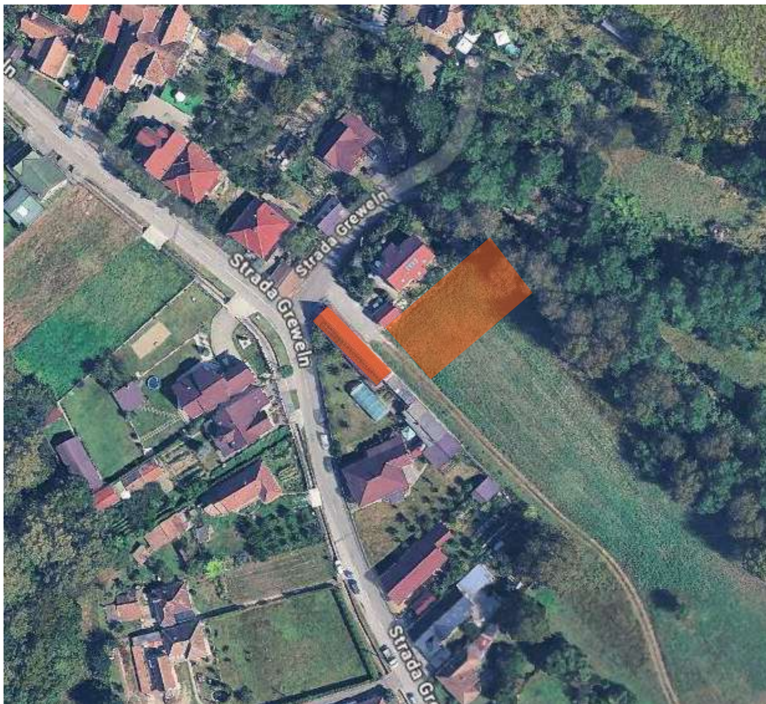
PLAN INCADRARE IN ZONA, sc. 1:1000