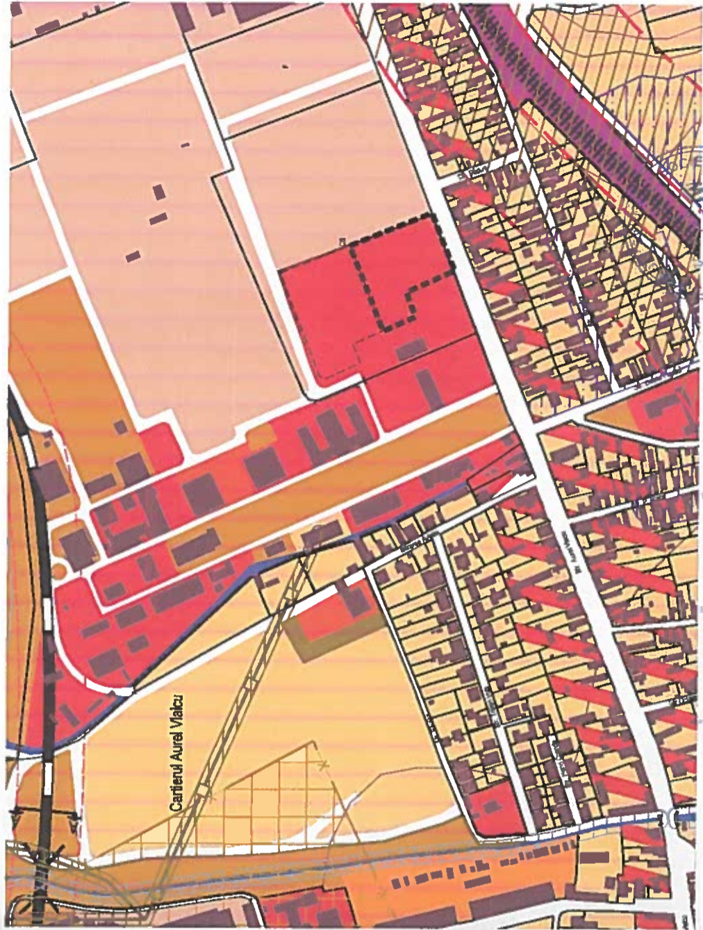
PLAN DE INCADRARE IN PUG scara 1:5.000

CONSTRUIRE «HOTEL» MEDIAS, str. Aurel Vlaicu nr.33